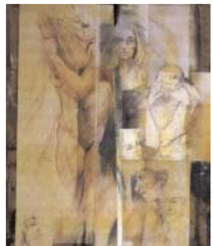
Mädchenträume, Pastell/Collage, 100 x 80 cm, 1997