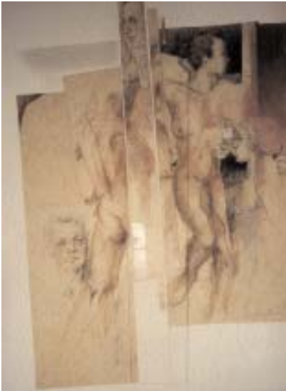
Die Gespenster, Pastell, 100 x 70 cm, 1997

I m Spannungsfeld von Farben, Schwüngen, Flächen und Linien entwickelt Mica Knorr-Borocco ihre abstrakten Werke, die sich im vibrierenden Licht eines durchaus spektakulären Farbenrausches transparent zu entfalten verstehen.