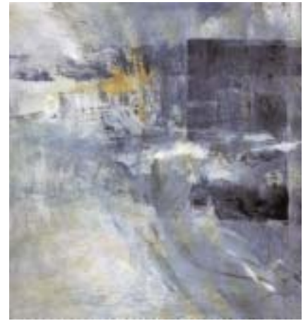
Durchblick, Acryl, 80 x 80 cm, 1998

Mica Knorr-Borocco, die sich Utting am Ammersee zum Lebens- und Schaffensraum gewählt hat, besticht in der Malerei durch ihre Vielschichtigkeit. Sie ist einerseits in der Lage, seelische Zustände als Momentaufnahmen des Lebens realistisch auf die Leinwand zu bannen, andererseits in abstrakten Farbsymphonien auf Gemälden in Öl und Acryl zu schwelgen, im freien Spiel der Gefühle und Empfindungen, die sie mit großer Geste in Szene zu setzen versteht.