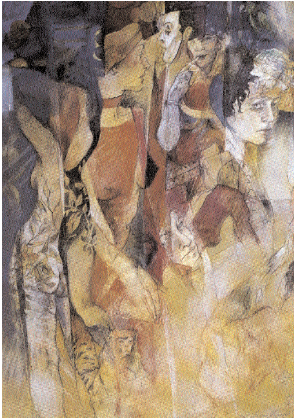
Vor dem Auftritt, Pastell Collage, 70 x 50 cm, 1996

Nicht minder beeindruckend präsentiert die Künstlerin ihre gegenständlichen Arbeiten, die sie in einen expressionistischen Duktus taucht, in dem menschliches Geschehen als Momentaufnahme im Mittelpunkt steht. Nur in dieser ständigen Ambivalenz zwischen Abstraktionismus und Realismus kann man das Oeuvre der Malerin begreifen, das einerseits von gegenstandslosen Spiegelungen geprägt wird, andererseits von