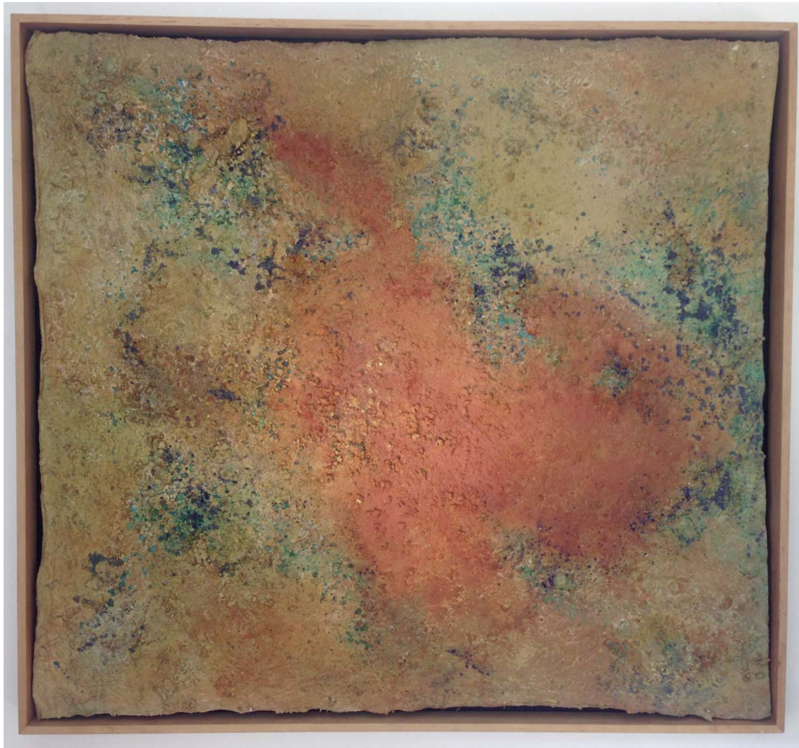
Bild Ulrike Arnold, Bisbee, Arizona, 2002, Sammlung Alexander Ehlers