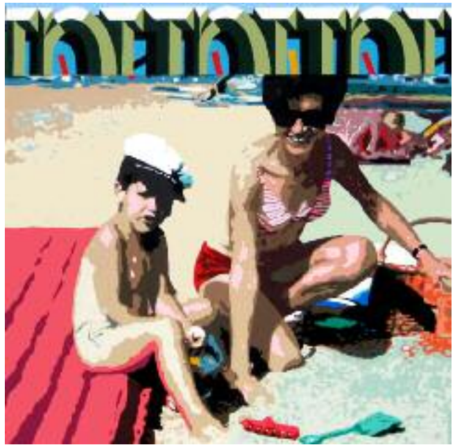
Sunny side of life 1967

nen früheren Jahren vorzugsweise angelehnt an die Pop-Art eines Roy Lichtenstein arbeitete, um heute - stilistisch gesehen - nur noch sich selbst zu verwirklichen.