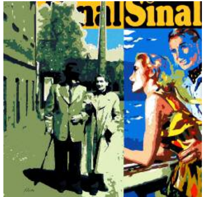
Late summer day 1954